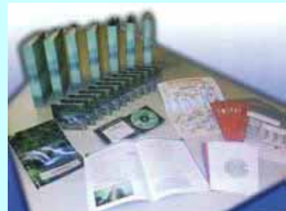
*MONITOR DE RELAJACION Y DESARROLLO PERSONAL

PROFESIONES DE GRAN DEMANDA Y AYUDA SOCIAL SALIDA LABORAL INMEDIATA