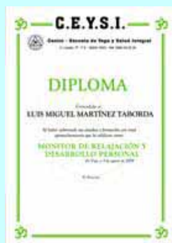
Monitor de Relajación y DP + Perfeccionamiento Presencial(*)