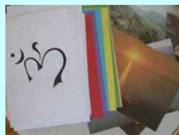
27 Fichas de concentración