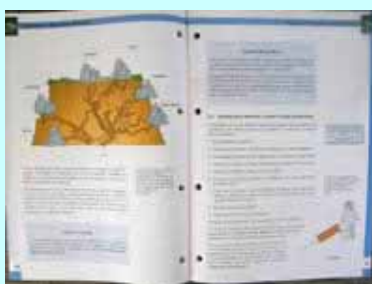
16 Manuales de Estudio a color