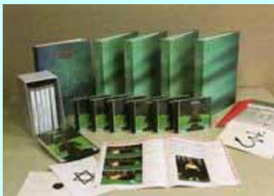
*MONITOR DE YOGA