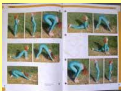
11 manuales de Estudio a todo color