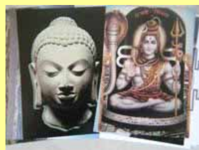
10 Fichas para concentración