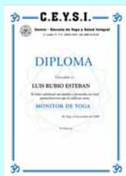
Monitor de Yoga+ Perfeccionamiento Presencial(*)

Los diplomas otorgados por el CEYSI® cumplen todos los requisitos legales a la hora de ejercer profesionalmente, amparados fiscalmente dentro de la rama de “ Terapias Sanitarias Alternativas o Parasitarias ” permitiéndote ser autónomo, darte de alta fiscal, desarrollar tu labor como profesional o abrir tu propio centro, contando siempre con nuestro apoyo. El Diploma oficial del CEYSI® te abrirá múltiples puertas laborales dado su prestigio profesional y reconocimiento nacional e internacional.